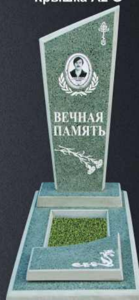
Крышка А2 G