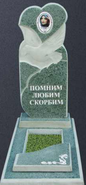
Крышка А4 G