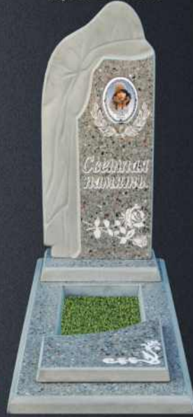
Крышка А2 Р