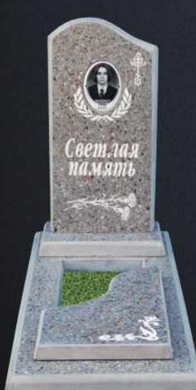
Крышка А5 Р