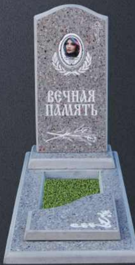
Крышка А4 Р