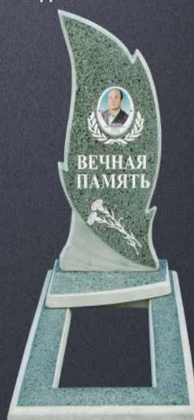
Подставка А104 G