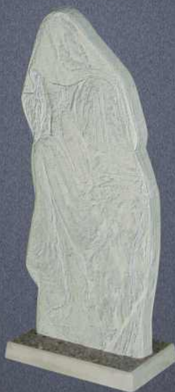
Скульптура Скорбящая мать А300