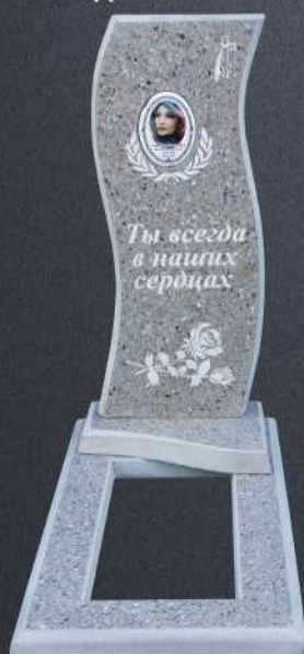
Подставка А105 Р