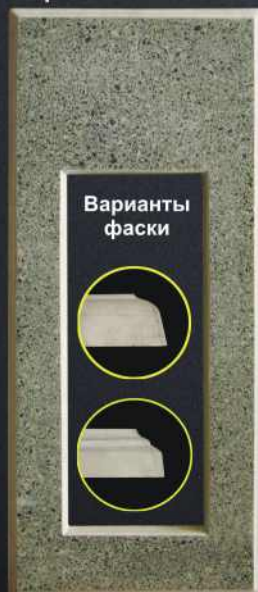
Цветник D100 G