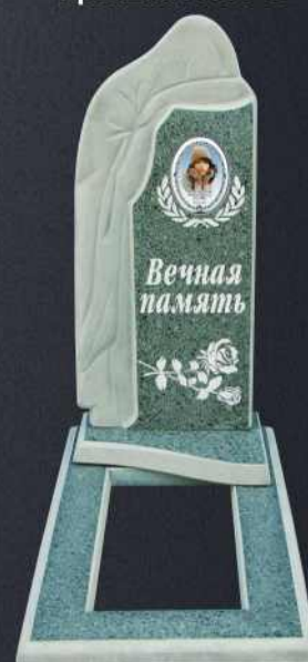
Крышка А105 G