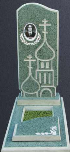
Крышка А3 G