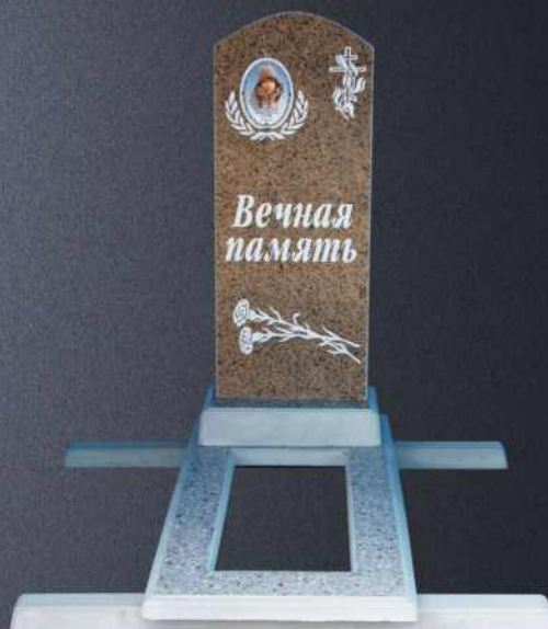
Балка монтажная А301