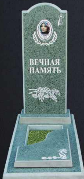
Крышка А5 G