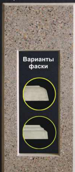
Цветник D100 Р