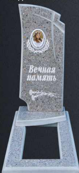
Подставка А104 Р