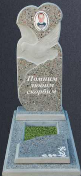
Крышка А3 Р