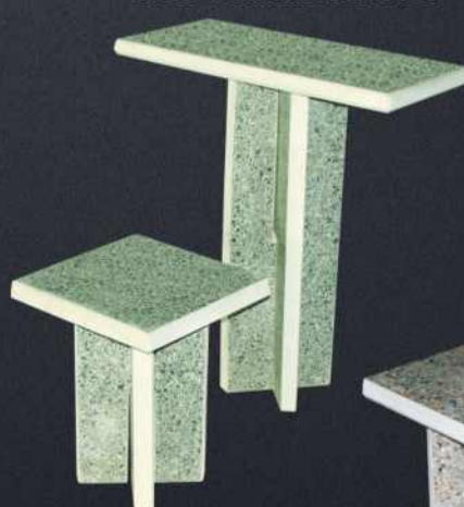
Стол и лавка SL100 G